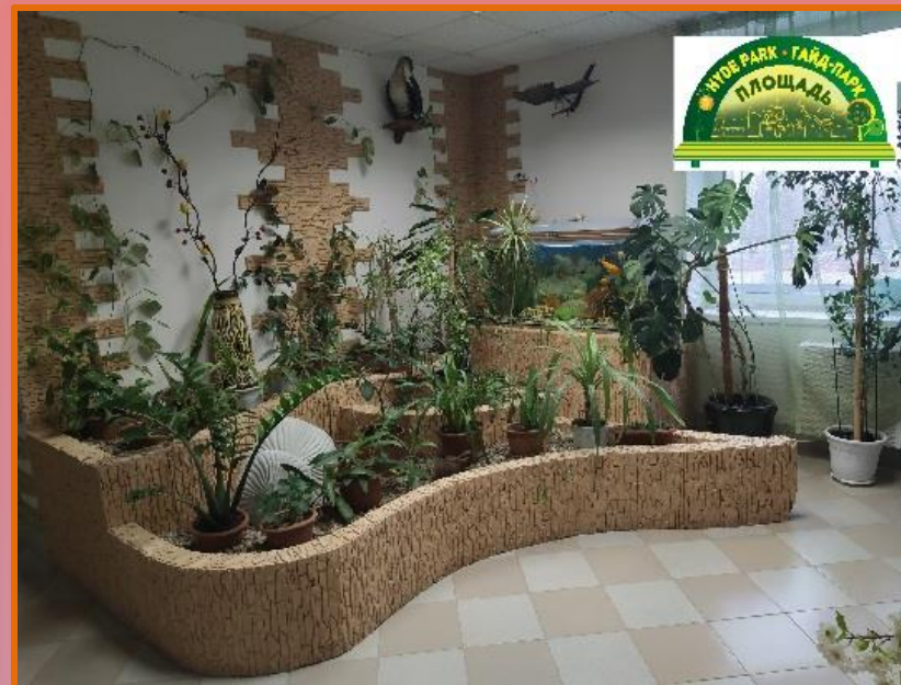
Пано «Времена года»