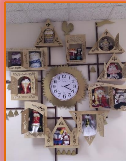
Вернисаж «Хоровод дружбы»